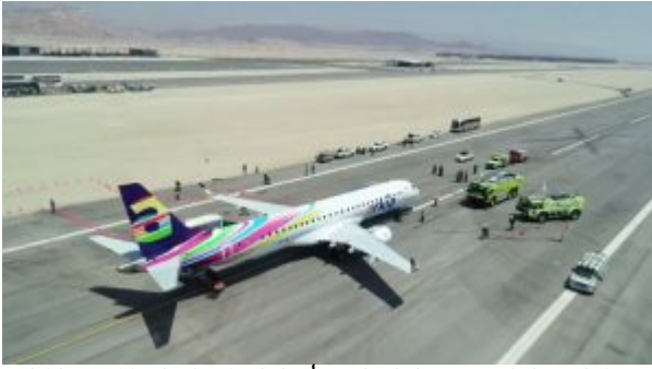
מטוס ארקיע שנחת בנמל התעופה רמון.

נמל התעופה הבינלאומי "רמון" נבנה בסטנדרטים הגבוהים ביותר של בטיחות. הנמל ממוחשב לחלוטין ומרושת במערכות טכנולוגיות מהמתקדמות בעולם. שדה התעופה החדש יכלול מערכת בידוק בטחוני עצמאי לטסים משדות התעופה הפנים ארציים מאילת, שדה דב ונתב"ג.