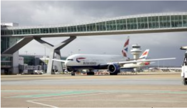
מטוס של בריטיש איירווייס בגטוויק.

הפרויקט הגדול ביותר לחמש השנים הבאות הוא ההרחבה המערבית, שתציע ליותר מחצי מיליון נוסעי הטרמינל הצפוני את האפשרות לצאת ממטוסייהם בדרך נוחה יותר, כמו גם אזורי המתנה משופרים בשערי היציאה.