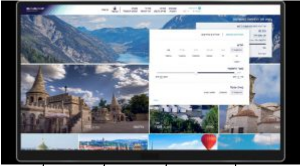
תמונת אילוסטרציה לגירסת הלפטופ.

דרך תוצאות החיפוש, יתאפשר לרכוש כרטיס טיסה ישירות ובאופן מיידי, או להגיש הצעה בזירת המכירות הפומביות ואולי לזכות באפשרות לרכוש כרטיס טיסה במחיר נמוך עוד יותר. לא מצאתם טיסה שמתאימה לכם? המחיר גבוה מידי? הירשמו להתראת מחיר באימייל ותקבלו הודעה במידה שהמחיר יתאים לתקציב שלכם.