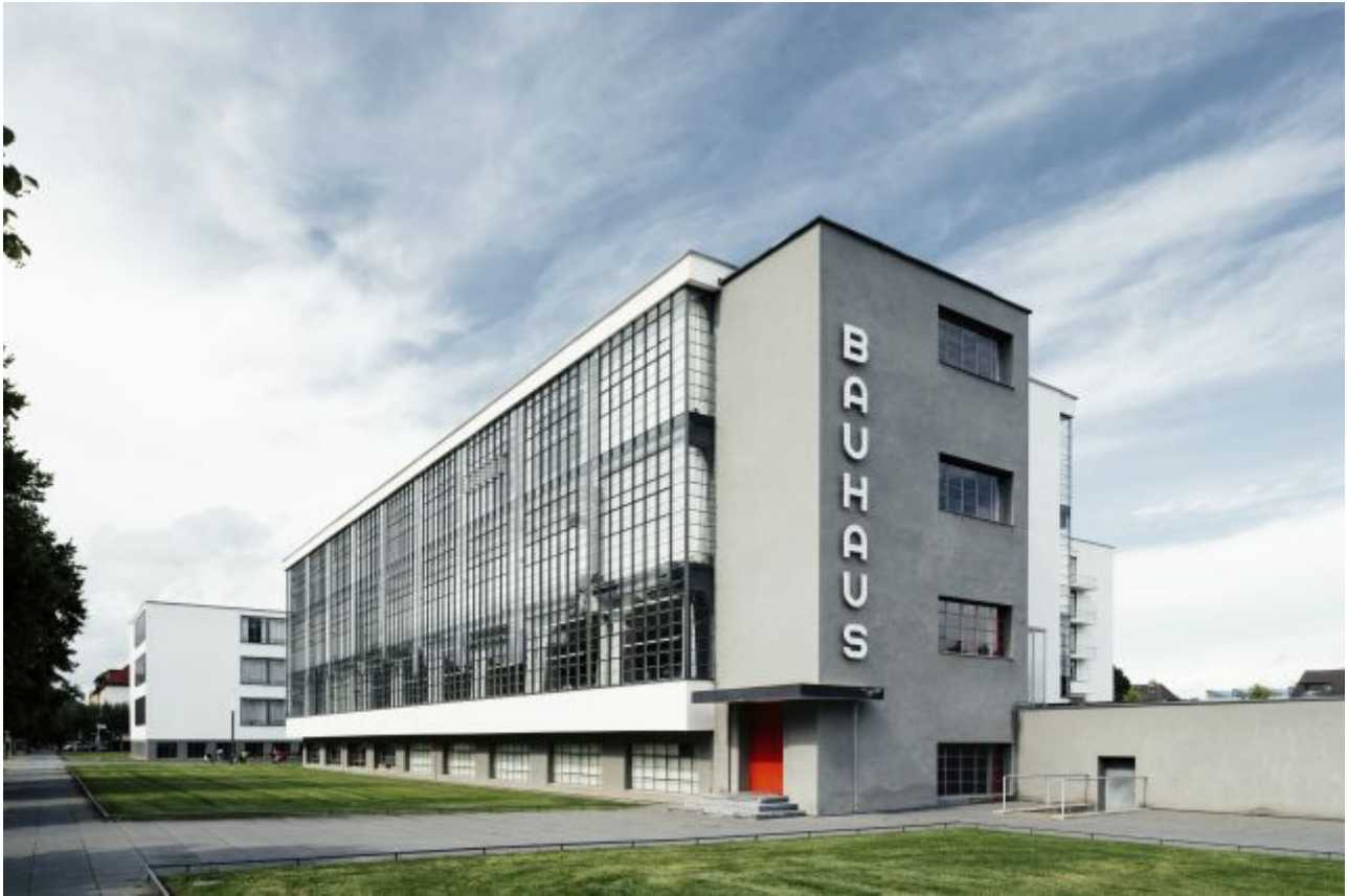
מבנה בסגנון באוהאוס. חי ובוועט.

בית הספר לעיצוב "באוהאוס" נוסד בשנת 1919 בעיר ויימר, הועבר לדסאו ב-1925 ונסגר על ידי הנאצים בברלין ב-1933, כך שפעל בסך הכל 14 שנים. למרות זאת, השפעתו נמשכת עד היום הזה בכל העולם.