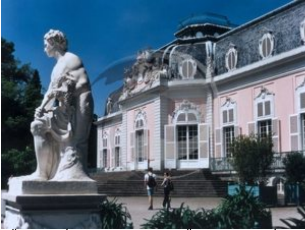
דיסלדורף, מכונה "הפנינה החבויה של גרמניה".

מכירת כרטיסי הטיסה ליעדים החדשים תחל ב-4/9/19.