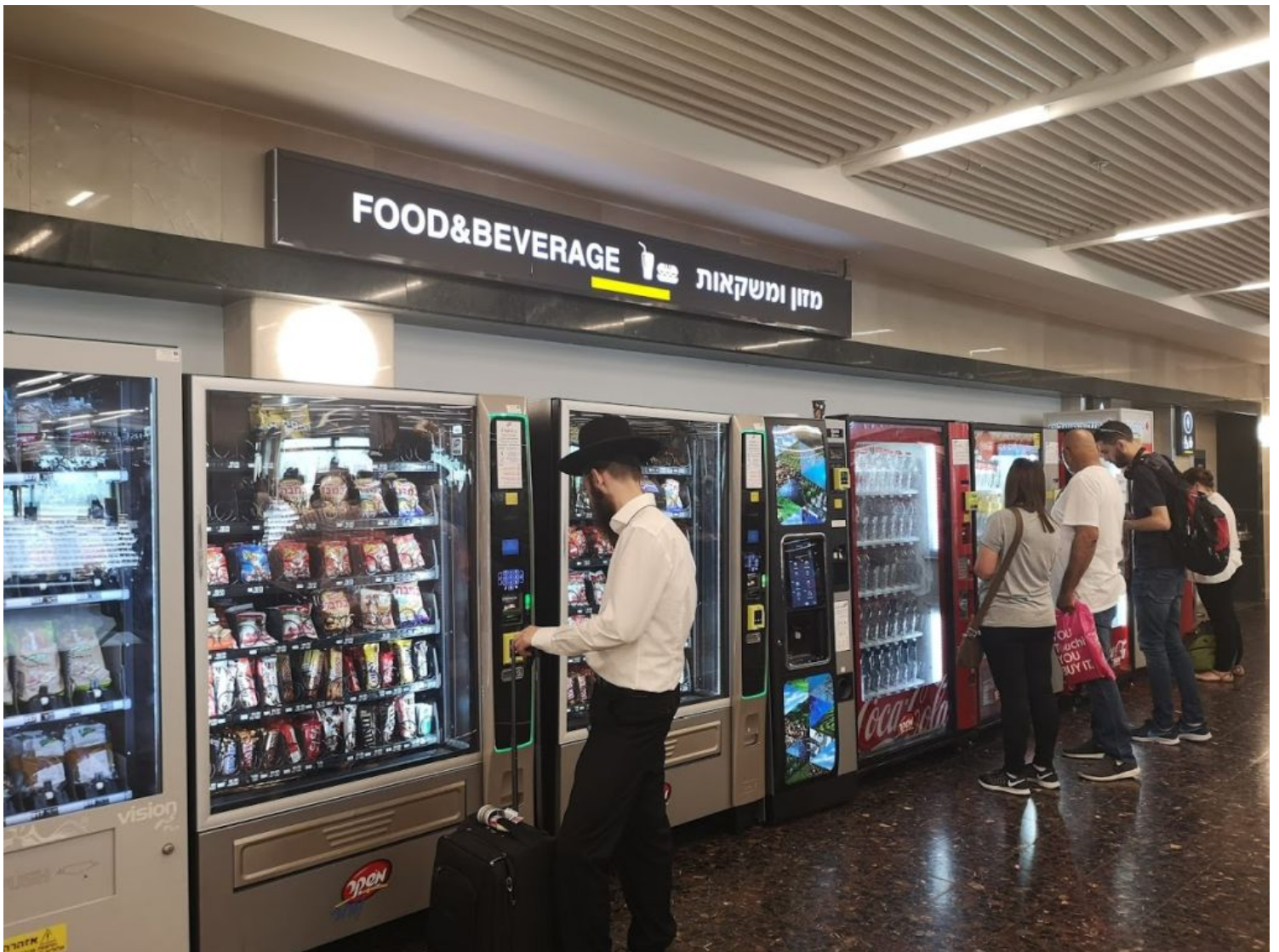
מכונות מזון ומשקאות לשירות עצמי בטרמינל 1. הפעילות טרמינל-1-רמון

בטרמינל 1 תסתכם הפעילות הבינלאומית במהלך חודשי הקיץ בגידול של כ-15% עם 345 טיסות שבועיות של יותר מ-16 חברות תעופה.