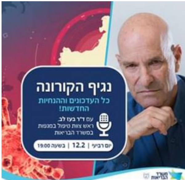
מודעה בדף הפייסבוק של משרד הבריאות