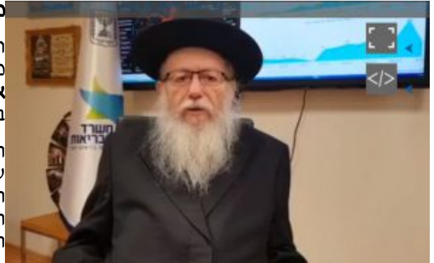
שר הבריאות יעקב ליצמן מתוך סרטון וידאו.

השר ליצמן ציין כי מטרת המשרד היא להעניק סיוע לישראלים שנמצאים על האוניה, לבחון חזרתם לישראל באופן בטוח עבורם ועבור הסביבה הישראלית. "אנו פועלים על פי הוראות ארגון הבריאות העולמי בכדי לדאוג להם וגם למנוע הדבקה בנגיף לאחר הגעתם", אמר השר ליצמן.