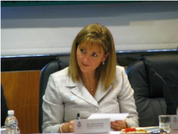
גלוריה גווארה, נשיאה ומנכ"לית מועצת הנסיעות והתיירות.

מגזר התיירות בהתפרצות הנוכחית של Covid-19. בניתוח הנתונים עולה כי עד 50 מיליון מקומות עבודה נמצאים בסיכון בתחום זה ברחבי העולם. לכשיגיע הזמן, WTTC והמגזר הפרטי העולמי יהיו מוכנים לעזור ולתמוך בממשלות ובמדינות להתאושש."