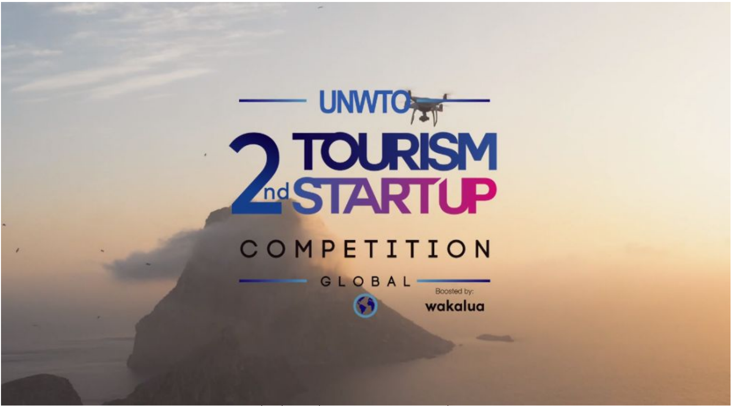
תחרות הסטארט-אפים התיירותית השנייה של ארגון רתיירות העולמי וגלובליה