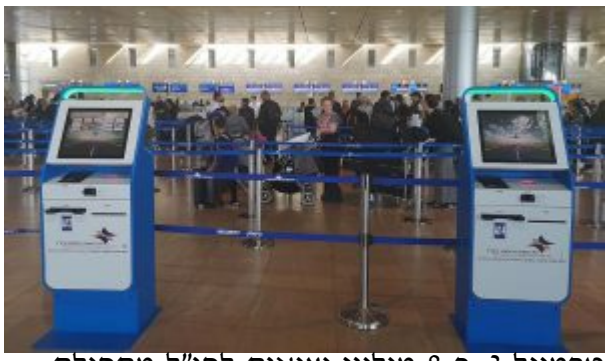
טרמינל 3. כ-8 מיליון יציאות לחו"ל מתחילת השנה.

בדרך האוויר נרשמו כ- 1.6 מיליון יציאות לחו"ל, עלייה של 11% לעומת אותה תקופה בשנה שעברה (1.4 מיליון). דרך היבשה נרשמו כ-167 אלף יציאות - עלייה של 31% לעומת שנה שעברה (127 אלף יציאות) ובדרך הים נרשמו 21 אלף יציאות לחו"ל של ישראלים. כידוע כיום פועלת רק חברת מנו ספנות בהפלגות מנמלי הארץ.