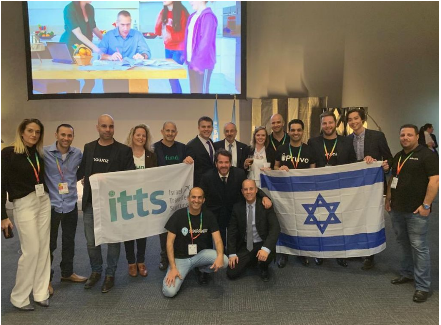
נציגי ארבעת הסטארט-אפים שהשתתפו בתחרות הבינלאומית של ארגון התיירות העולמי במדריד.

https://www.youtube.com/watch?v=51LRjUoCOL4