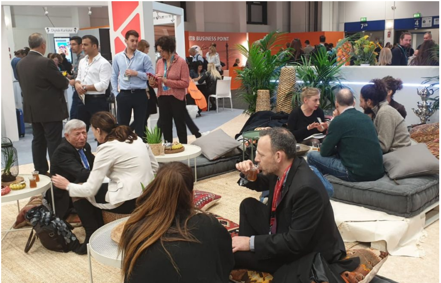
אוירה בדואית בביתן משרד התיירות בתערוכת התיירות ITB בברלין 2019. הדימוי הבטחוני של ישראל השתפר

בדומה לנתונים של 2018, 38% מהתיירים בעולם טוענים כיום שמצב פוליטי בלתי יציב ואיומי טרור, ישפיעו על תכנון החופשה שלהם ל-2019. תיירים ממדינות באסיה מרגישים הרבה יותר מושפעים מאיומי טרור מאשר תיירים ממדינות אחרות. במונחים של איזה סוג איומי טרור ישפיעו על התנהגותם, הרוב הגדול של המשיבים קבע שיבחרו רק יעדים שנחשבים ל"בטוחים". לצד זאת, הדימוי הבטיחותי של כמה יעדים השתפר מעט ב-12 החודשים האחרונים ובהם טורקיה, ישראל ומצרים