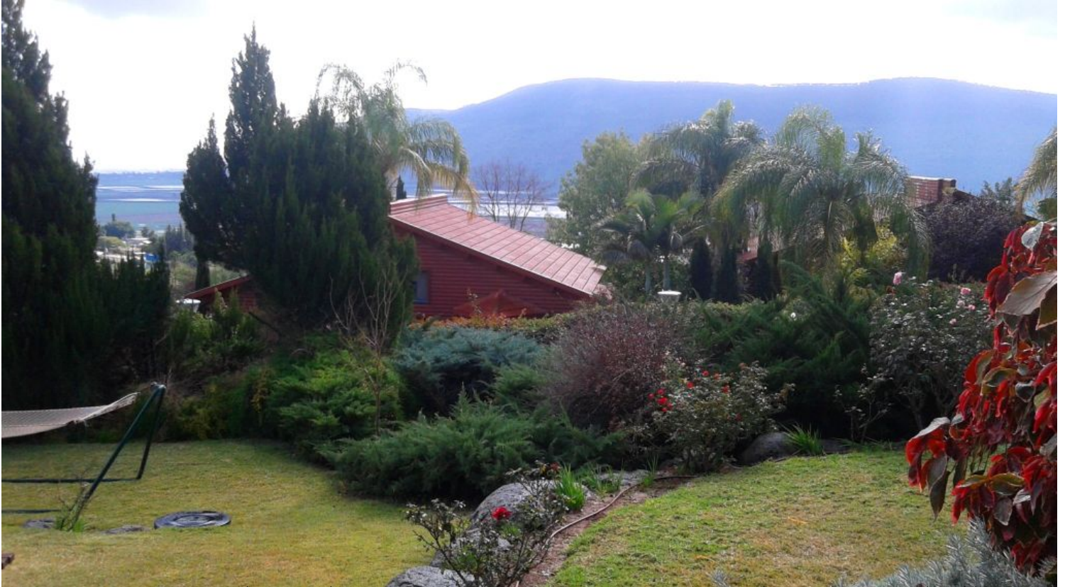
מראה כללי על מתחם הארוח של עין חרוד איחוד. ירוק בעיניים ונופים ברקע. צילום שוש להב תיירות אירוח ואטרקציות בעין חרוד איחוד:

באזור הפורח ושופע המים של עמק חרוד והרי הגלבוע, נמצא שפע אטרקציות תיירותיות. במרחק נסיעה קצרה מעין חרוד ישנם אתרים מדהימים ביופיים וגנים לאומיים יחודיים. ניתן לשלב טיולים רגליים, רכובים, טיולי אופניים ורכבי שטח, פעילויות אקסטרים חווייתיות עם ג'יפים, בהם נגיע לפינות חמד נסתרות, סנפלינג מהרי הגלבוע, שייט קיאקים אתגרי בנהר הירדן, גלישה מרהיבה מהר הגלבוע באמצעות מצנחי רחיפה ואטרקציות רבות אחרות, כיד הדמיון הטובה.