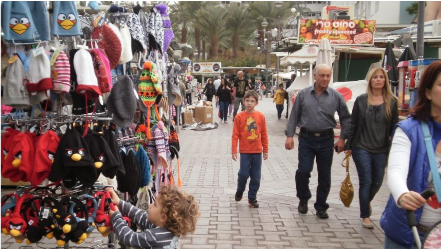
הטיילת לפני תום עידן הבסטות. כיום פועל במקומם מתחם Bazaar Eilat שנמצא בסמוך לגשר.