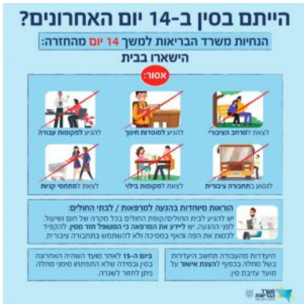
מודעה של משרד הבריאות על הנגיף

לדבריו, מכיוון שנכון להיום אין באוכלוסיה של ישראל חיסון נגד הנגיף, מתמקדת פעילות משרד הבריאות בנסיון למנוע את הגעת הנגיף לישראל והתפשטותו. "בהתאם לכך, אחד הכלים המרכזיים לצמצום הסיכוי להגעת המחלה לישראל ולהכלתה אם תגיע, הוא מתן הנחיות ברורות לנכנסים לישראל. לפיכך אני מבקש שכלל הנכנסים לישראל יקבלו מסרון למכשירי הסלולר עם כניסתם לישראל כדלקמן: