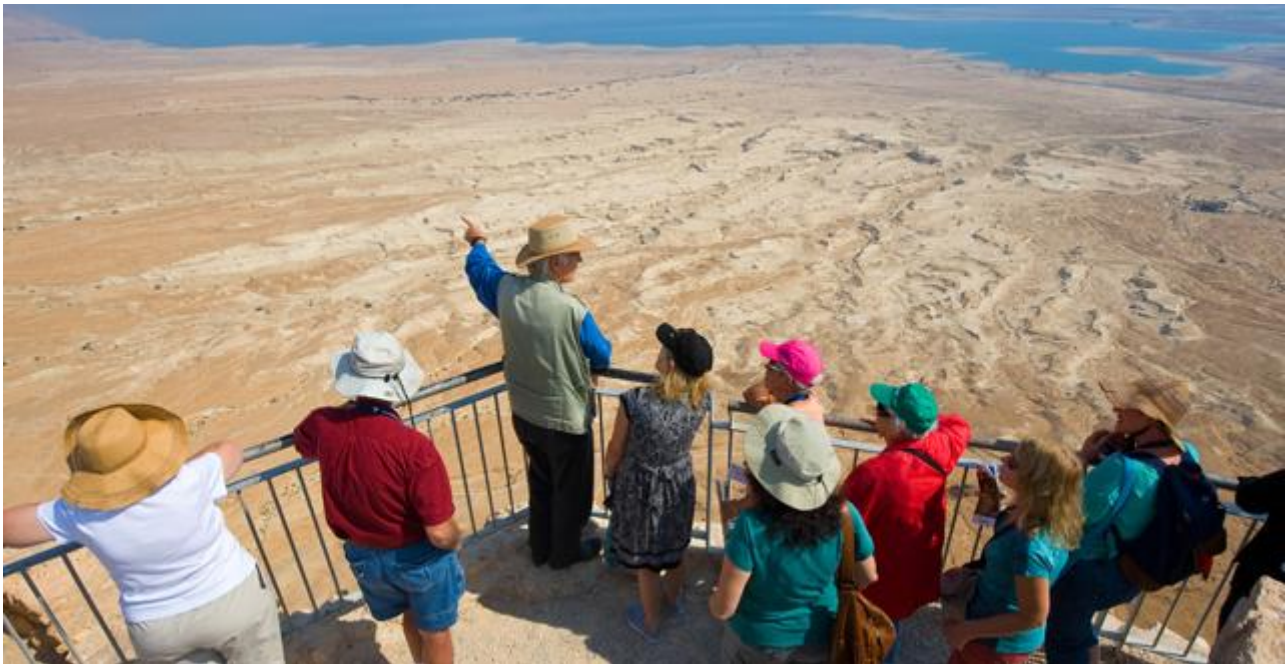
תיירים בישראל. שנת 2017 היתה שנת שיא בכניסות התיירים. ישראל צמחה, מצרים עשתה קאמבק, דובאי ולבנון המשיכו לגדול

ברישומי הארגון ממוקמת ישראל בדרום אירופה/הים התיכון, ולפי הנתונים הגיעו לאזור זה בשנת 2017 266.2 מיליון תיירים, עלייה של 12.3%. נתח השוק שלו (Share) בתיירות העולמית היה 20%. עם כל הכבוד לישראל, את רוב התיירות גרפו דווקא השותפות האחרות באזור זה: טורקיה - שרשמה התאוששות מרשימה - וספרד ואיטליה, שכל אחת מהן הוסיפה 6 מיליון תיירים לאמתחתה.