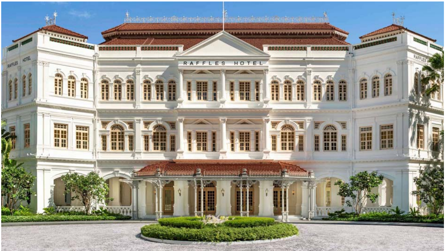
סינגפור סלינג - Bukit Batok, סינגפור.