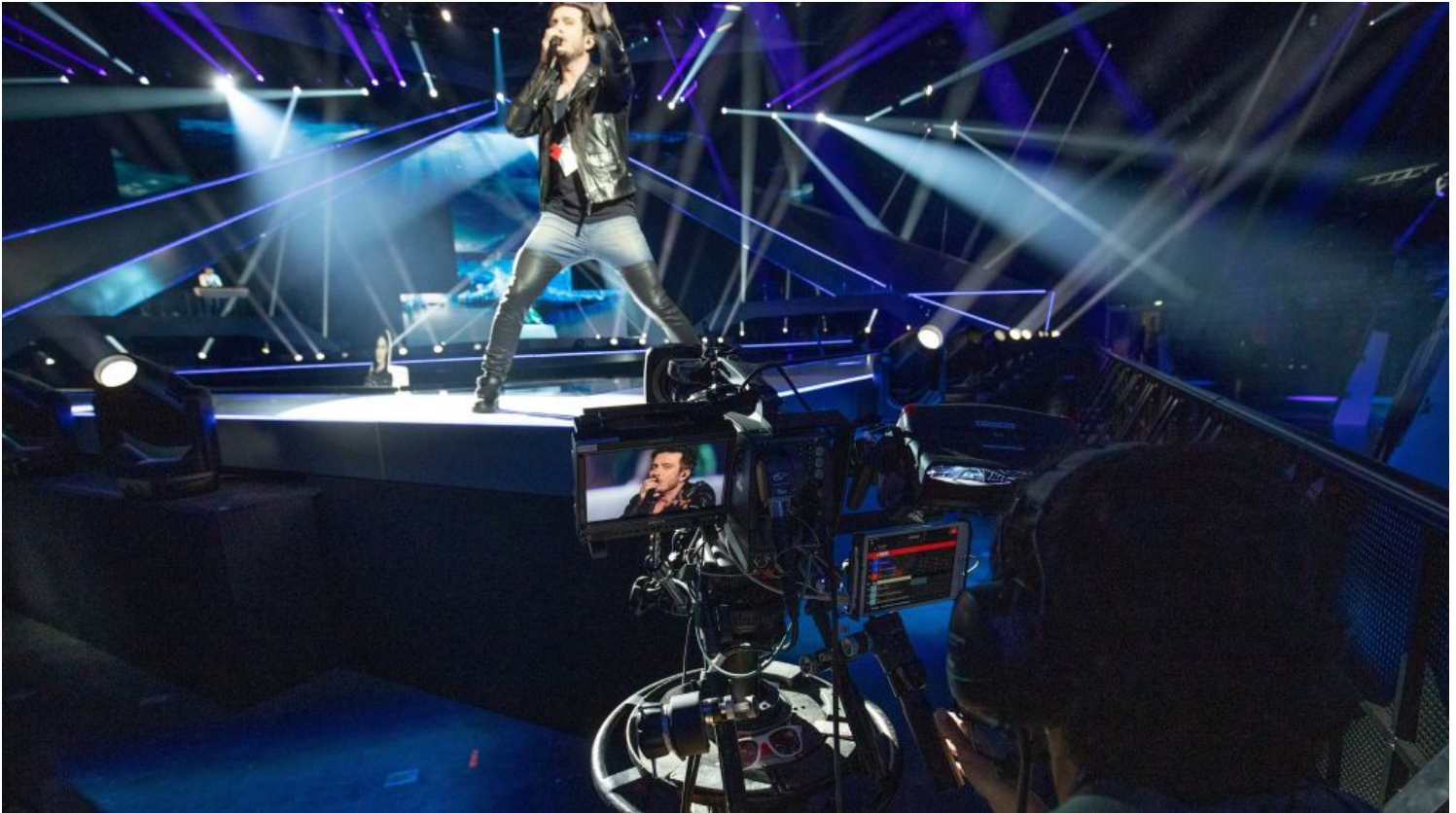
מאחורי המצלמה באירוויזיון. אירוע של צופים נלהבים עם תקציב נמוך

גרוּפּמַן מספר שהתאגיד, שהפקת האירוויזיון היא בסמכותו, שריין 3,000 חדרי מלון בשביל המשלחות מ-41 מדינות. באזור תל אביב יש 11 אלף חדרים ובחודש מאי התפוסות בעיר גבוהות מאד ממילא ובמאי שעבר, למשל, הגיעו התפוסות ל-85%. כך שהתוספת הצפויה של 3,000 חדרים נראתה גבוהה. אלא שבחיים עצמם מומשו רק 750 חדרים למשלחות. "רואים את המספרים", מסביר גרוּפּמַן, "כל משלחת של 20 איש והם מפוזרים ב-35-40 מלונות. היו הערכות שיגיעו 2,000 אנשי תקשורת, אבל יש הרבה גופים עם נציגים בארץ ונציגויות ותאגידיים שנכללים כבר במשלחות. וכך כשהמעגל הראשון של האנשים שהגיעו עם המשלחות נמוך מהצפוי וממה שביקשו שישריינו להם השתחררו הרבה חדרים. מכירת הכרטיסים התאחרה מאד מכל מיני סיבות לוגיסטיות ומחירם הגבוה הרתיע הרבה אנשים מלרכוש אותם. גם העובדה שיש רק 7,500 מקומות ישיבה למכור לעומת כ-10,000 בשטוקהולם או בקייב - גרמה לעליית מחירי הכרטיסים".