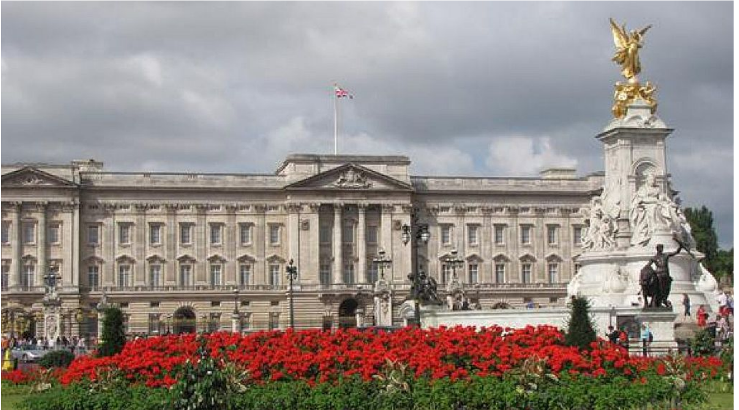
ארמון בקינגהם.בלונדון, העיר המובילה בתיירות העסקים באירופה. לברר עם הבוס תחילה

לפני שמתתחילים לעשות תכניות נסיעות עסקיות כלשהן המערבות בן משפחה או מישהו משמעותי אחר, עליך לבקש תחילה את אישור המעביד שלך. זה תלוי במקום העבודה ובתרבותו, שכן הבאת מישהו לנסיעת עבודה, עשויה להיראות כהטבה לעובד שלא עולה לחברה אגורה או, מנגד, כהסחת דעת ממשימת הנסיעה. כדאי לשתף את הבוס לפני כל נסיעה כזו, גם אם זו לא הפעם הראשונה שאתה מצרף מישהו מטעמך לנסיעה.