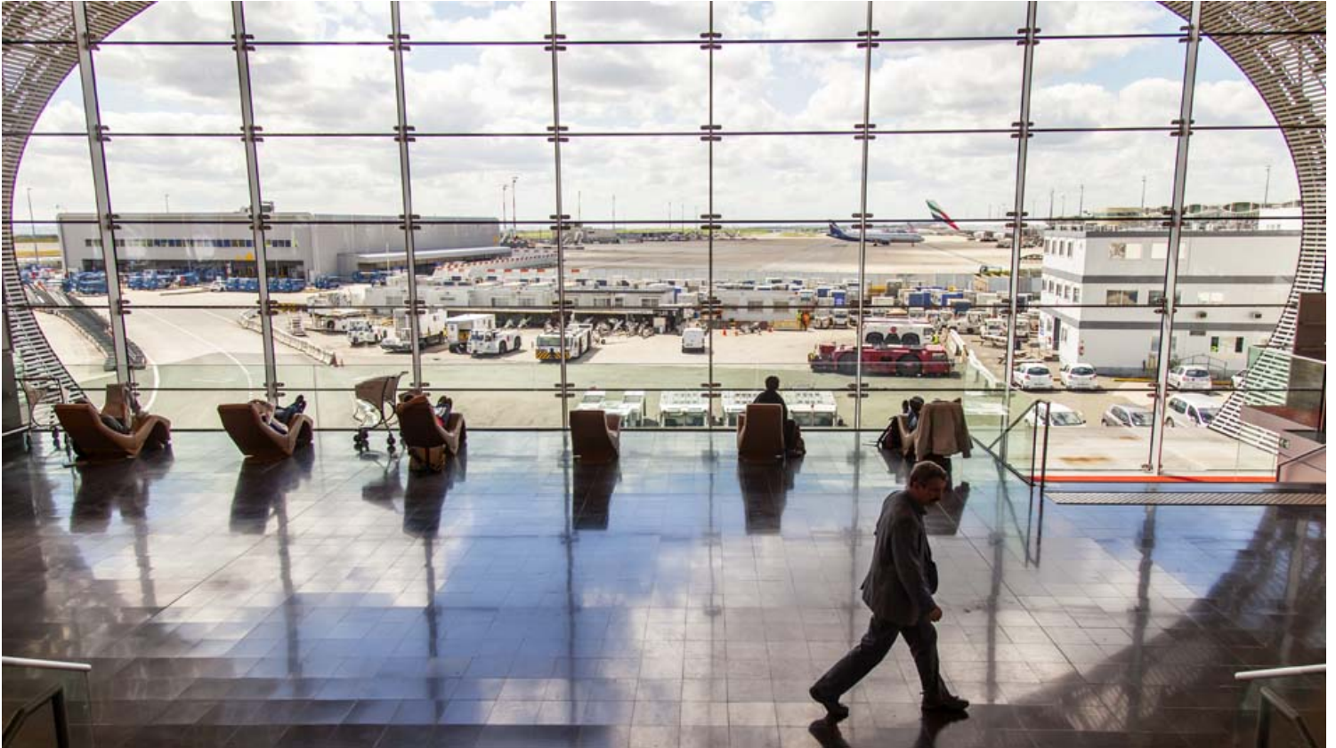
נמל התעופה פריז שארל דה גול .

נמל התעופה פריז-שארל דה גול (Paris-Charles de Gaulle Airport -CDG) נקרא על שם הגנרל והנשיא הצרפתי לשעבר, בנייתו של נמל התעופה שארל דה גול הושלם בשנת 1974. נמל התעופה היה מדורג השני העמוס באירופה מזה מספר שנים ועוברים בו 72.2 מיליון נוסעים בשנה.