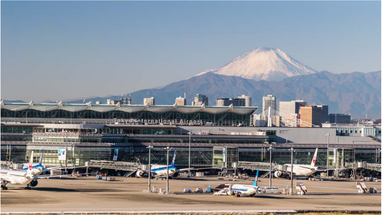
נמל התעופה טוקיו האנדה.