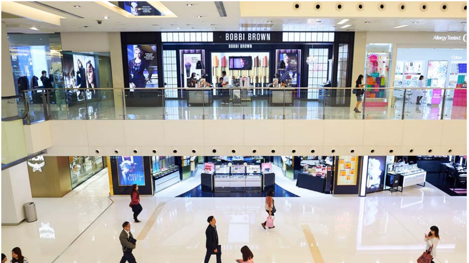
יוסטון ג'ורג' בוש אינטרקונטיננטל.