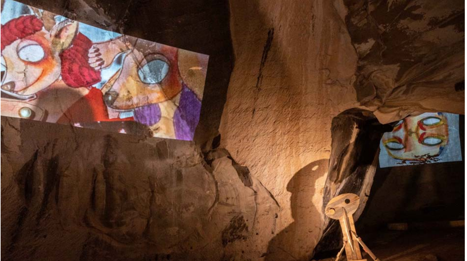
מתערוכת צורות אנוש במערות בית גוברין.

הכניסה לתערוכה ללא תשלום נוסף על דמי הכניסה לאתר. חינם למנויי מטמון יש לתאם ביקור לתערוכה לפני הגעה לאתר.