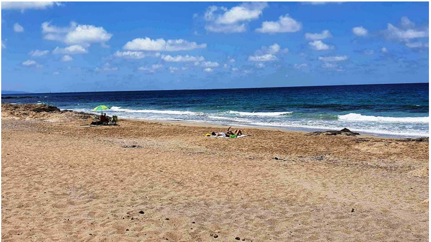
חוף אכזיב.

18 הרשויות שזוכות בעונת הרחצה הנוכחית לתגבור של יותר מ-7,000 שעות שיטור, הן: נתניה, הרצליה, מועצה אזורית חוף הכרמל, מועצה אזורית עמק חפר, אשקלון, מועצה אזורית מטה אשר, קריית ים, איגוד ערים כינרת, אשדוד, נהריה, טירת כרמל, עיריית עכו, חיפה, תל-אביב יפו, מועצה אזורית חוף השרון, בת ים, חדרה ואילת.