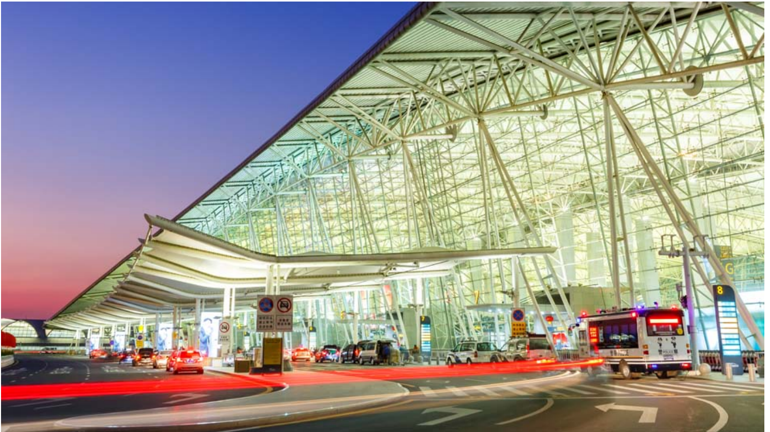
נמל התעופה הבינלאומי גוואנגז'ו באיון .

ודורג במקום ה-13 ברשימה. ב-2019 טיפס למקום ה-11 עם 73.3 מיליון נוסעים וב-2020 חווה אפילו ירידה של 40% בתנועת הנוסעים, אך ידע להתאושש מהר יותר מהמתחרה באטלנטה.