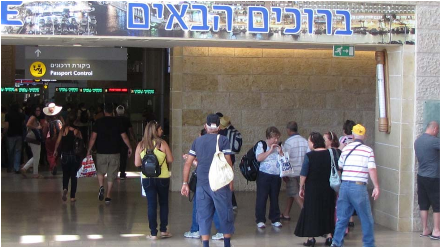
נוסעים נכנסים בנתב"ג.

בדברי ההסבר להצעת החוק נכתב: במישור הבין-לאומי התקבלו בשנים האחרונות כמה החלטות במועצת הביטחון של האו"ם ולפיהן על המדינות החברות באו"ם להקים מערכות נתונים API - מערכות המכילות את הנתונים המופיעים בדרכון או במסמך הנסיעה של הנוסע, לרבות שם הנוסע, אזרחות, סוג מסמך הנסיעה, מספרו ותוקפו, וכן נתונים לגבי חברת התעופה ומספר הטיסה שבה הוא מגיע. בהחלטות אלה אף נקראו המדינות החברות לדרוש מחברות התעופה הפועלות בשטחן להקדים ולספק נתוני API לרשויות הלאומיות המתאימות. לפי אתר האינטרנט של ארגון חברות התעופה הבין-לאומיות - IATA, יותר מ-70 מדינות מחייבות את חברות התעופה להעביר אליהן נתוני API ועוד מדינות מתכננות להטיל חובה כזו.