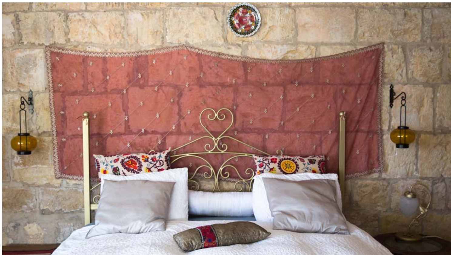
החאן של מייק. צילום בוקינג קום