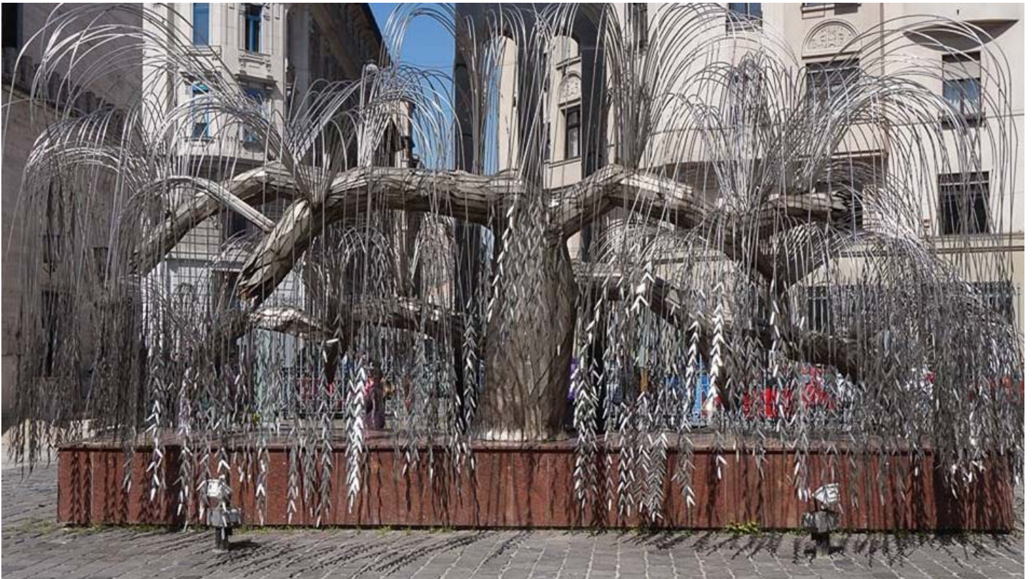
פארק הזיכרון להנצחת יהודי הונגריה ולראול ולנברג.