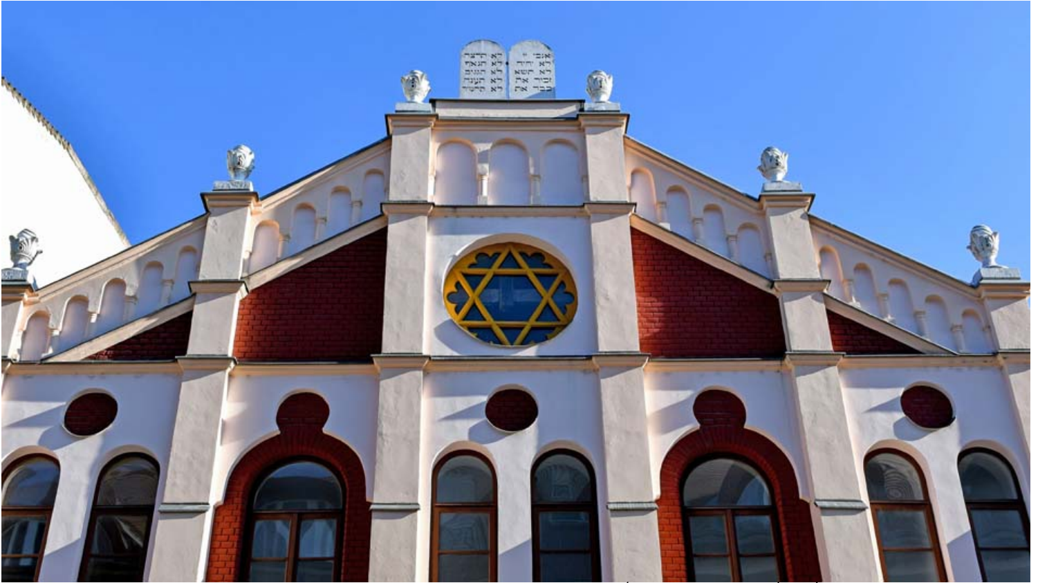
בית הכנסת בדברצן. צילום לשכת התיירות של הונגריה