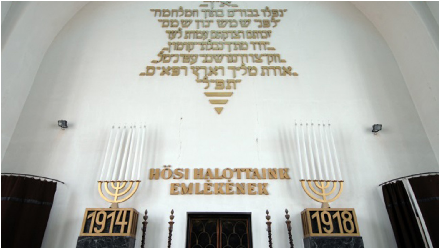
בית כנסת באזור בודפשט.