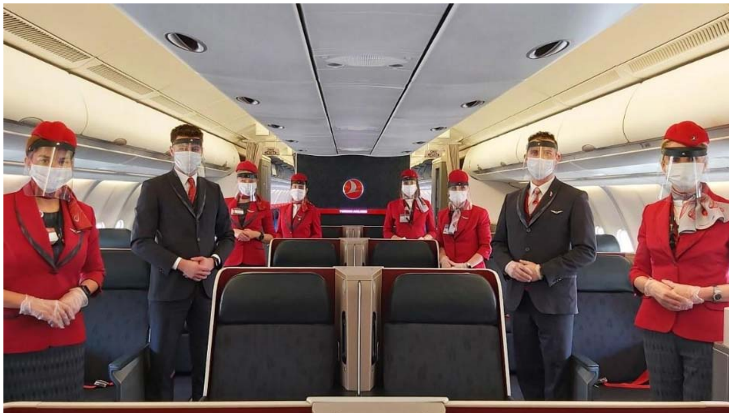
טורקיש איירליינס: שומרים על בטיחות הנוסעים והצוות.

אנא בקרו ב- http://www.covidinsurance4turkey.com כדי להגיש בקשה ולקבל מידע מפורט.