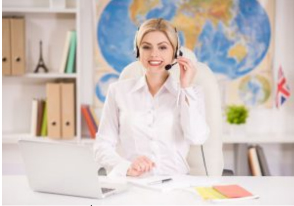
משרדי הנסיעות חווים תקופה שלא ידעו כמוה.

כתבה קודמת: משרדי הנסיעות ויאט"א במסלול התנגשות