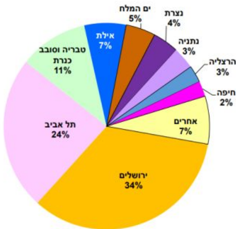
תירות נכנסת : 11.6 מיליון לינות