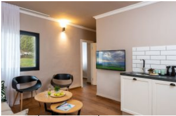
חדר עם מטבחון במלון ארץ דפנה של רשת מטיילים.

המלון מציע 53 דירות ארוח בשלושה אגפים: בכל דירה חדר שינה, ספות נפתחות, מיזוג אוויר, טלוויזיית LCD, מקלחת מעוצבת, מטבחון, מיני מקרר, מיקרוגל וערכת קפה. יובל של נחל הדן זורם ממש צמוד לחדרים. עוד ניתן למצוא במלון מגרש משחקי ילדים, בריכת שחיה ומגרש כדורגל. מלון מטיילים ארץ דפנה הוא השישי במספר לרשת מלונות מטיילים ומצטרף למלונות: הוילג', גשר הזיו, מלכיה, אילון ומטולה.