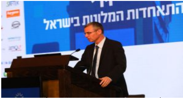
יריב לוי, שר התיירות בוועידת המלונאים 2018. צילום יח"צ

תיושם, הינה צעד חשוב בכיוון הנכון". השר לוי הודיע כי הוא ימשיך לפעול כדי להבטיח שאזרחי ישראל כולם יזכו ליחס שווה וימשיך לחזק את התיירות בישראל, לרבות ביהודה ושומרון.