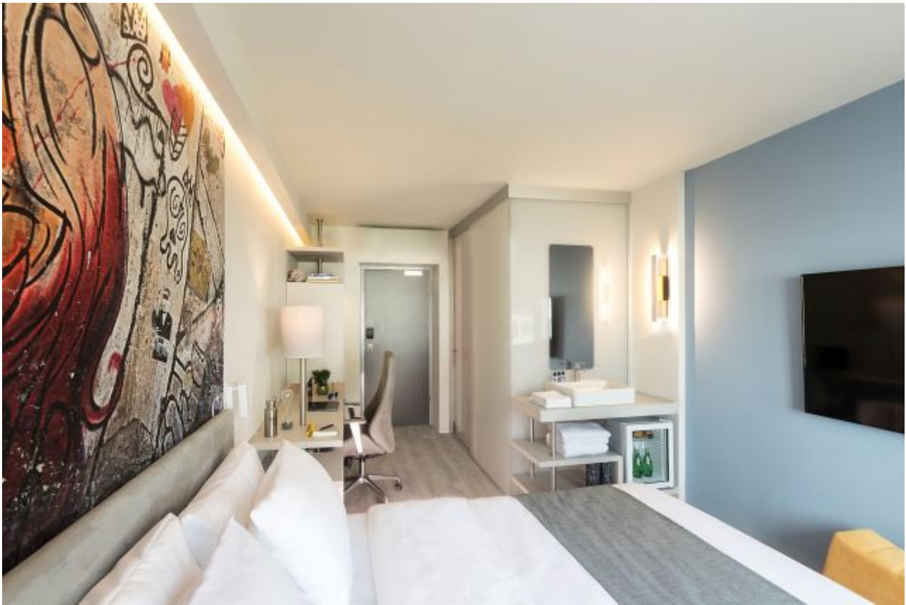
חדר במלון לינק תל אביב. מלון ראשון במותג החדש. צילום דניאל לילה רק אל תקראו לי בוטיק

ברשת דן שאלו את עצמם מדוע שישראל לא תוביל במלון טכנולוגי, עם אמנות שמחברת את האורחים לעיר שבה הם נמצאים ויוצרים את הקונספט הייחודי. ואכן, הבשורה של המלון החדש היא הדיגיטליות שלו. המלון מציע לאורחים את LinkApp - אפליקציה חדשנית ומקיפה לתפעול השהות במלון, המאפשרת לבצע צ'ק אין וצ'ק אאוט, להזמין אוכל ושתייה ושירותי מלון ולבצע מגוון פונקציות בתוך החדר: לפתוח את החדר, הפעלת הטלוויזיה, הפעלת המזגן וכוונן הגדרות עוצמת האור והאווירה בחדר.