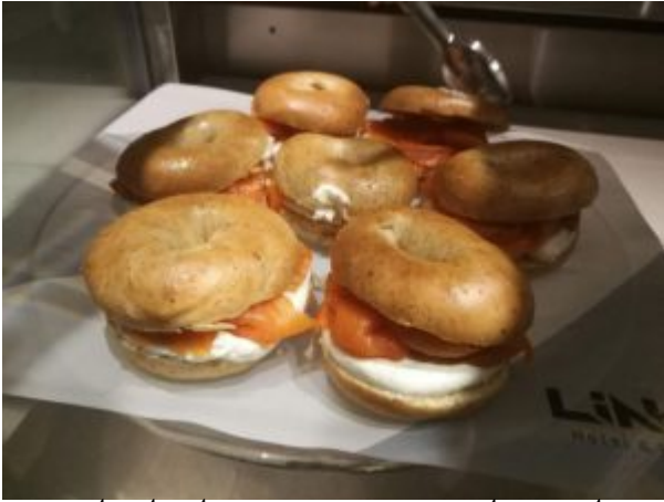
בייגל עם סלמון וגבינה במזנון של מלון לינק.

לדברי פדרמן הם מכוונים להיות זולים בכ-20% מהמתחרים, שהמחיר ינוע בין 150-200 דולר ללילה לפי העונה, לא כולל מע"מ ולא כולל ארוחת בוקר. פדרמן אמר ביושר שהם לא יכולים להתחייב לגמרי על המחיר, אבל "אנחנו מכוונים לשמור על רמת מחיר שאנשים לא ירגישו שמנצלים אותם".