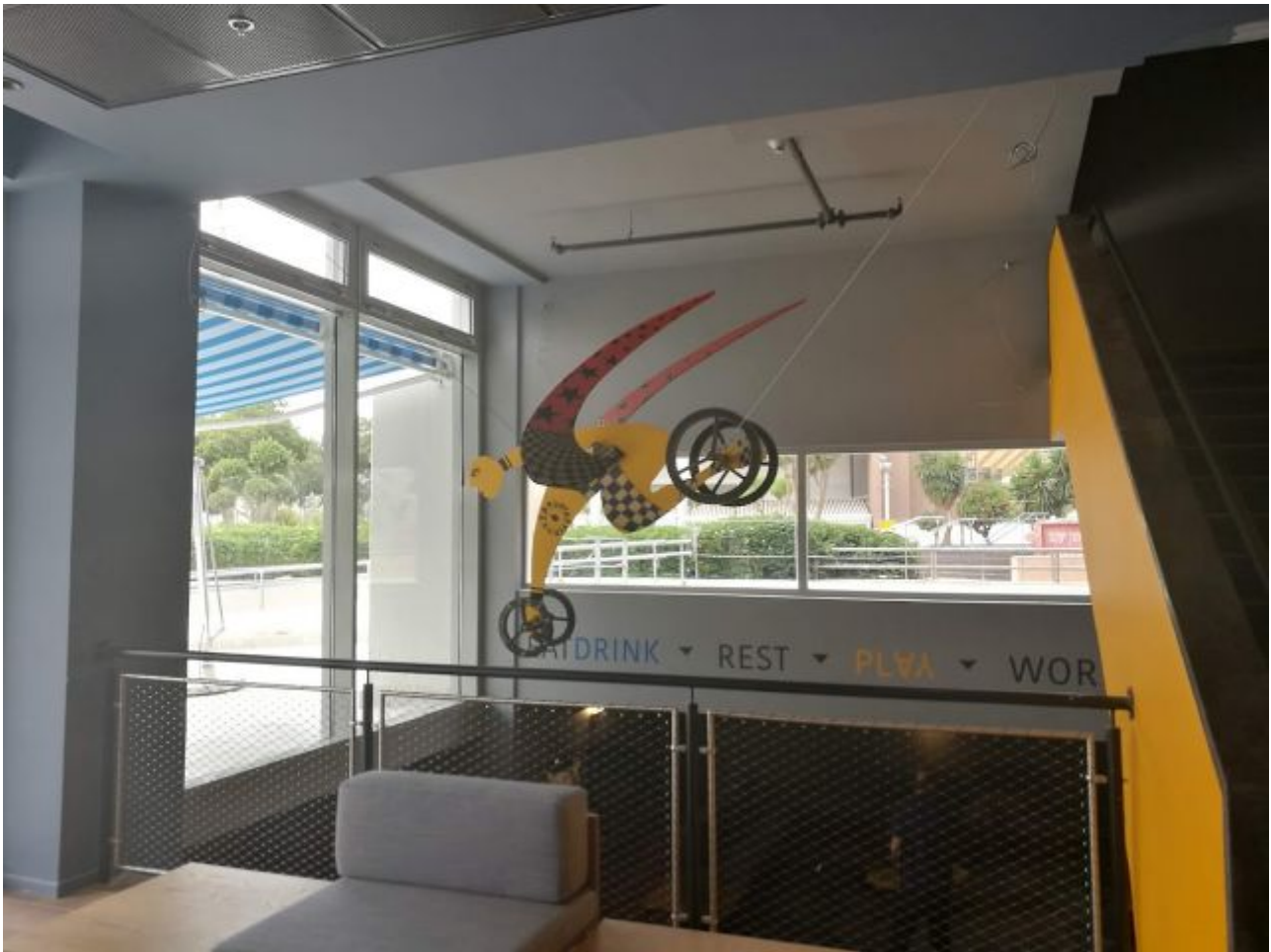
פינה במלון לינק של רשת דן בתל אביב.

צוות המלון, הקרוי בפי ההנהלה Link Crew, כמו צוות אוויר במטוסים, מורכב בחלקו מעולים חדשים-ישנים, שעברו הכשרה, בעיקר בחיי הלילה של תל אביב, ויודעים לתת מענה על שאלות האורחים שמבקשים למצות את המסיבות והמסעדות ובתי הקפה האיננים בעיר.