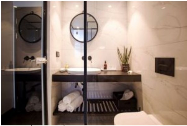
חדר אמבטיה באגף הצפוני במלון דניאל הרצליה.

שעוצבו מחדש בקונספט אסיאתי המבוסס על יסודות הטבע: אש, מים, עץ, אדמה ומתכת שישפרו את האווירה וההרגשה הכוללת במקום.