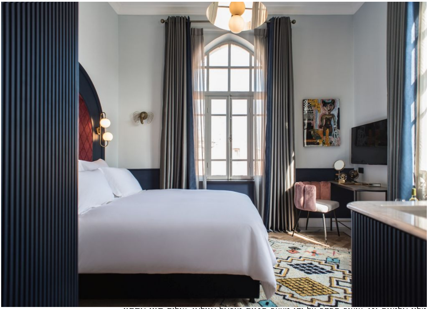
מלון אלמינה יפו. עיצוב החדר על ידי מעצב הפנים מיכאל אזולאי. צילום סיון אסקיו ביפו נפתח מלון Elmina

ואילו ביפו נפתח בימים אלה נפתח מלון Elmina יפו ("נמל" בערבית) בבניין לשימור בן 100 שנים, בעל ייחוס תרבותי היסטורי מהתקופה העות'מאנית. המבנה בו ממוקם המלון, הוקם בסוף שנות העשרים של המאה הקודמת כבית מגורים, המשלב חנויות ומסחר. בשנת 1998 עבר הבניין תהליך שימור מיוחד כחלק מתוכנית שימור מבנים של העיר ת"א-יפו.