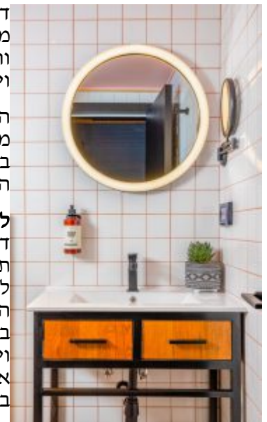
פינת רחצה במלון דייב לוינסקי.

המחיר לחדר ללילה על בסיס לינה וארוחת בוקר בספטמבר הוא החל מ-440 שקל. במסגרת חודש ההרצה, ניתנת הנחה של 30% על כל הזמנה בין ה-30-1 בספטמבר. כמו כן ניתנת הנחה של 50% על הלילה השני במבחר מלונות מקולקציית בראון במסגרת מבצע חגים.